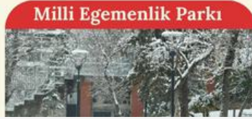
Milli Egemenlik Parkı