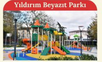
Yıldırım Beyazıt Parkı